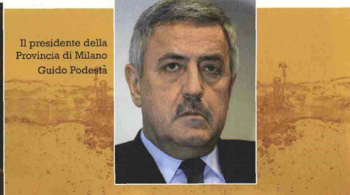
Il presidente della Provincia di Milano Guido Podestà